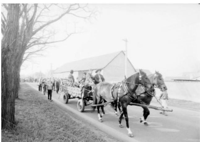
Masopust v Ostré – 90. léta 20 století

Ačkoli nejde o církevní svátek, termín masopustu se určuje podle data Velikonoc (Velikonoční neděle vychází v roce 2021 na 4. dubna). Masopustní úterý předchází Popeleční středě, která v letošním roce byla 17. února. Právě ona zahájila letošní předvelikonoční postní období. Díky tomu, že Velikonoce jsou svátkem pohyblivým, může masopustní neděle připadnout na období delší než měsíc (od 1. února do 7. března).