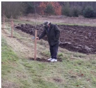
sázení stromků, 29.11. 2020